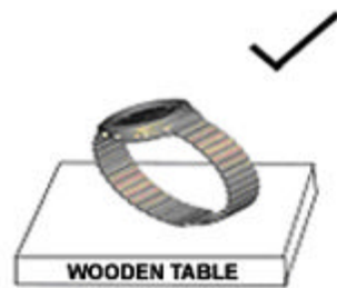
METAL CASE & BAND